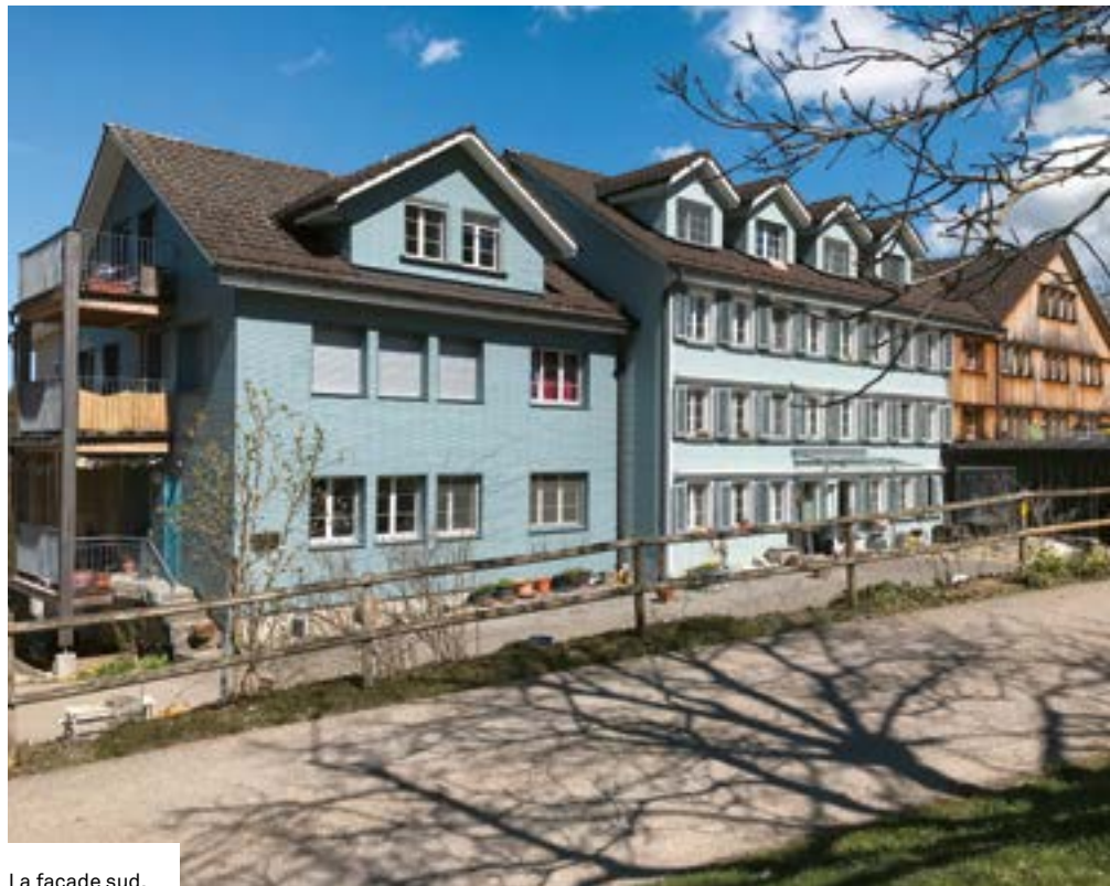
La façade sud.

La coopérative Wogeno-Mogelsberg a défini cinq valeurs sur lesquelles elle base son style de vie: écologie, communauté, responsabilité, activités sociales et d'entraide, éthique. Elle est autogérée et fonctionne sur un mode participatif. D'un point de vue organisationnel, les différentes structures mises en place au départ ont fait leurs preuves. Toutes les décisions importantes sont prises par une assemblée générale qui a lieu une fois par mois et un comité est en charge de la coordination, des aspects adminis-