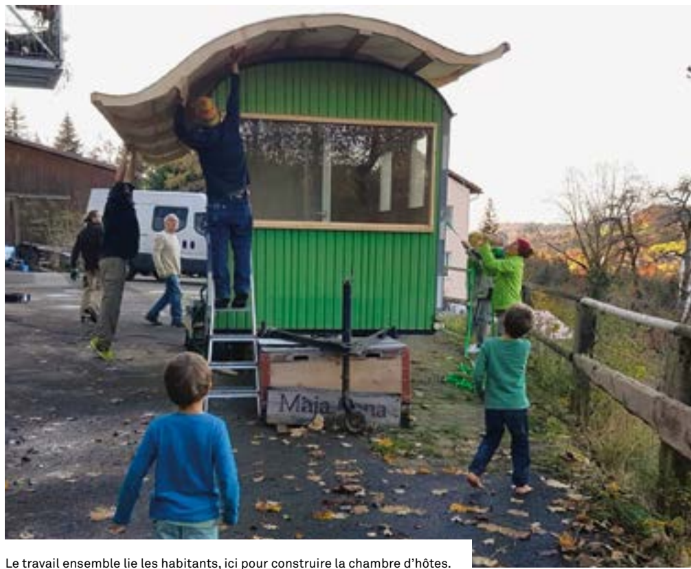
Le travail ensemble lie les habitants, ici pour construire la chambre d'hôtes.